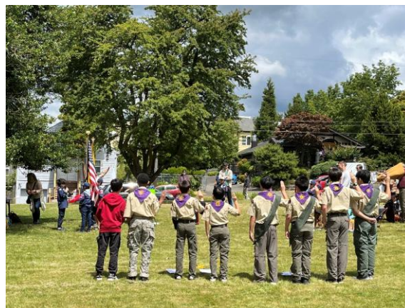
ブルー&ゴールド・セレモニー