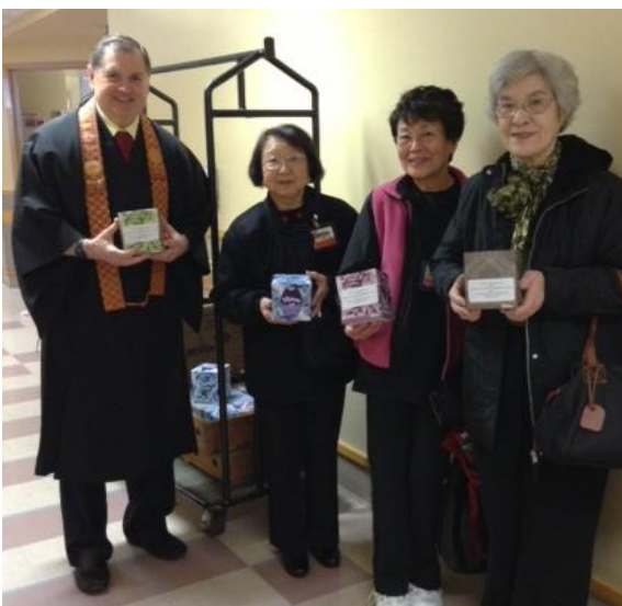
敬老ホーム訪問とばら寿司作り