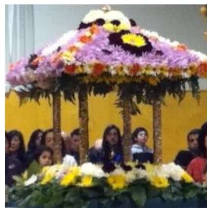
花祭りの御堂 4月8日

誰でも気軽に参加して下さい。初心者も歓迎です。もしセットをお持ちでしたら持ち寄って下さい。頭の運動になります。